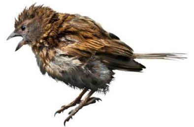
Dans son personnage de NOURS