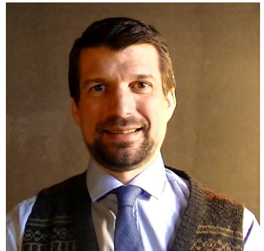
Dans son personnage de GUS